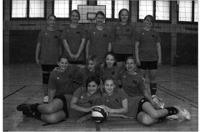
B16 aktuell März 2011 - 21 -